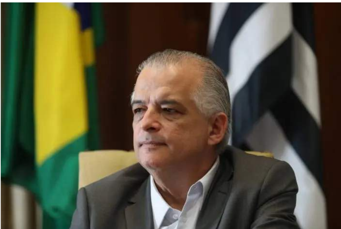
O ex-governador de São Paulo, Márcio França.