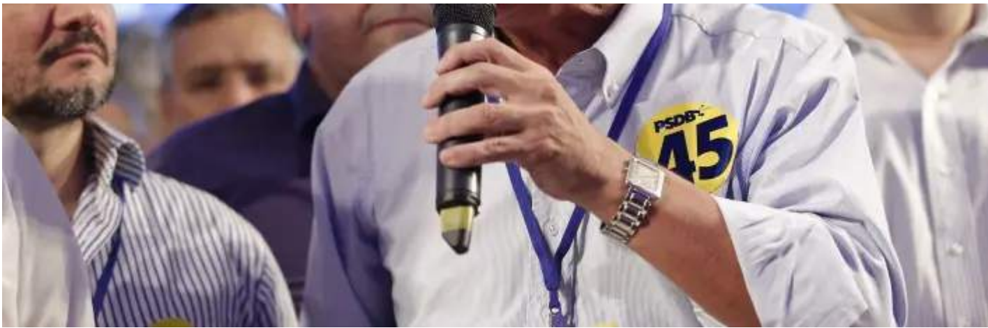
O ex-governador de São Paulo, Geraldo Alckmin.

Nas ações, formalizadas em março de 2019, o Ministério Público de São Paulo alegou que Alckmin e França, que se sucederam no governo paulista, desrespeitaram uma recomendação do Tribunal de Contas do Estado para que, a partir de 2017, o Executivo readequasse a gestão orçamentária , destinando os recursos do Fundeb ‘exclusivamente para manutenção e desenvolvimento do ensino’.